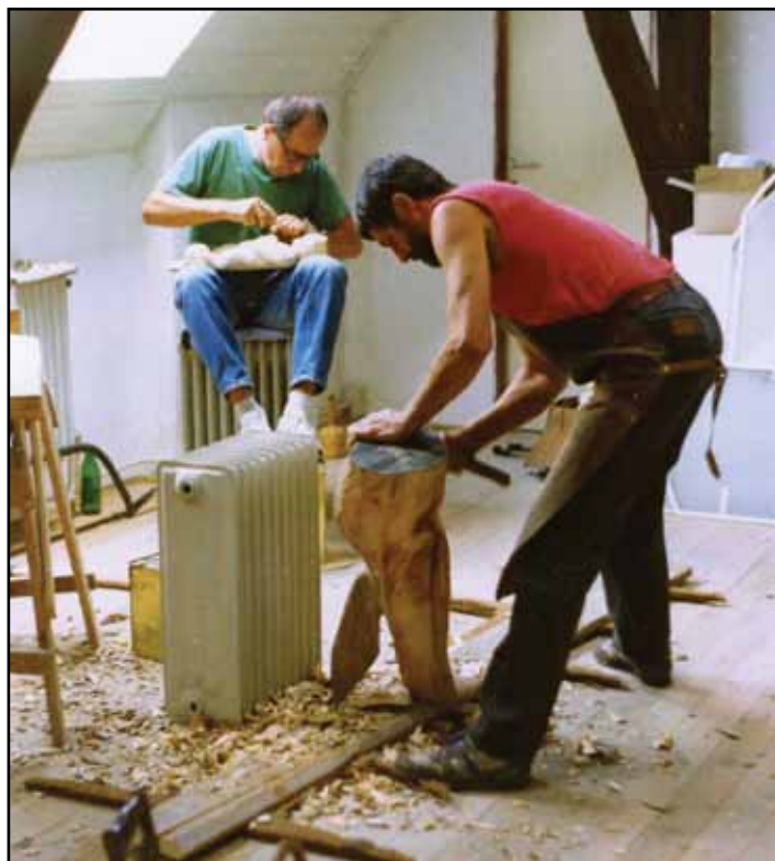
Když přšelo, pracovalo se na půdě muzea.