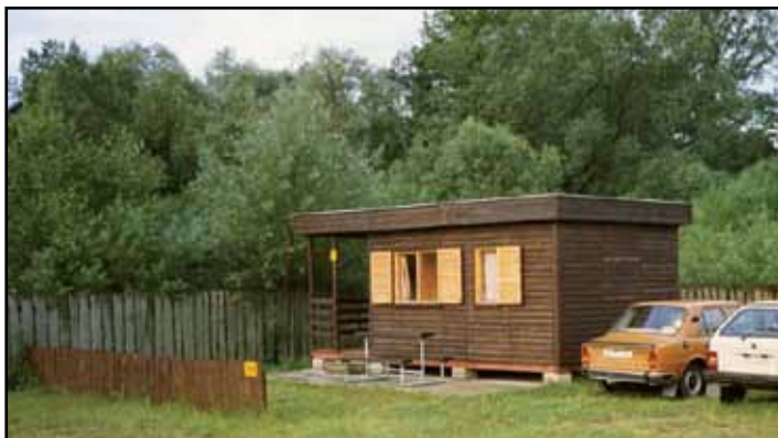
Ubytování pro řezbáře bylo zajištěno v kempu v nedaleké Dubici.