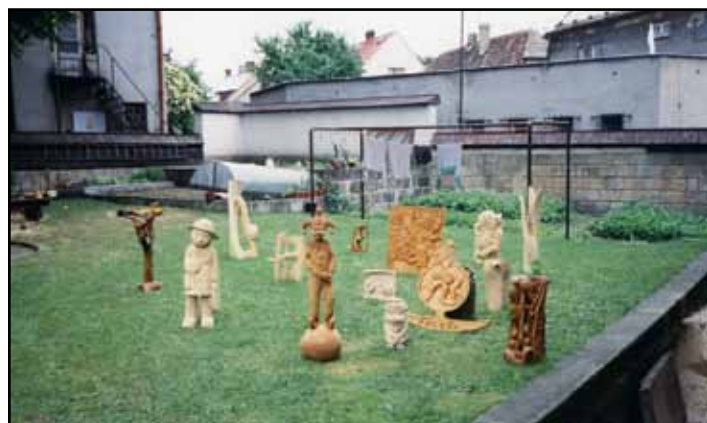
Zahrada Památníku K. H. Máchy ožila dřevěnými postavami.

Čím dál vzácnější jsou a budou věci udělané rukama. Od poraženého kmene až k míse či sošce ide cesta dotýkání a hlazení. Po celý život se dotýkáme dřeva.