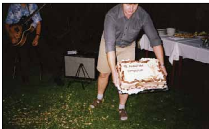
Sladká tečka v podobě řezbářského dortu