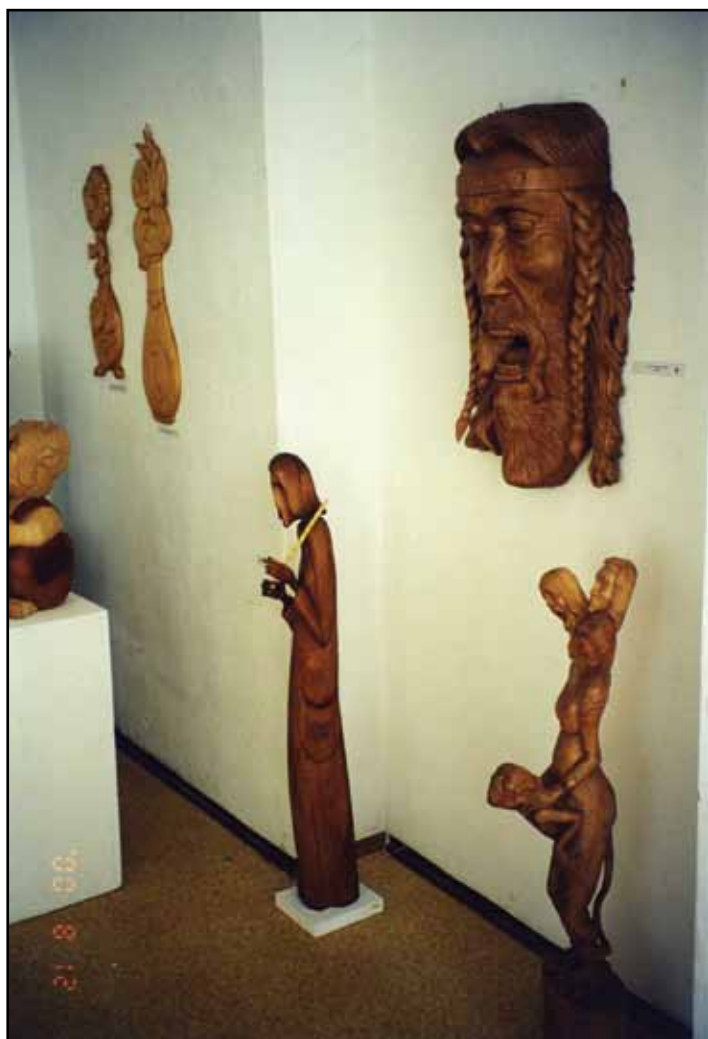
Výstava v Malé galerii Městské knihovny Doksy