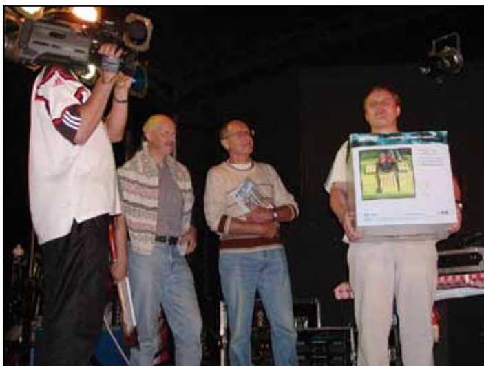
Vítězné ankety přebírají ceny.

Od začátku prázdnin představili řezbáři svá díla na výstavě Umění řezbářů v Městské knihovně v Doksech. Návštěvníci výstavy rozhodli svými hlasy o třech vítězných dílech, která se veřejnosti nejvíce líbila. Předání cen oceněným řezbářům proběhlo 3. září během večera slavnostního zahájení Euro her v Doksech.