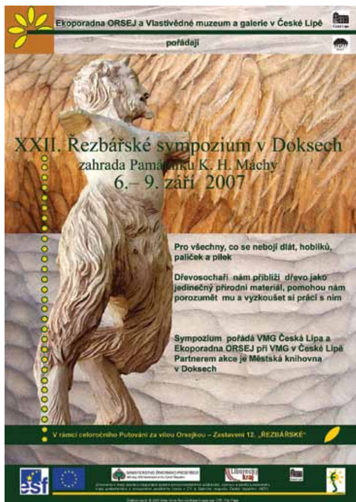
rok 2007, plastika Atila Vörös, autor Atila Vörös