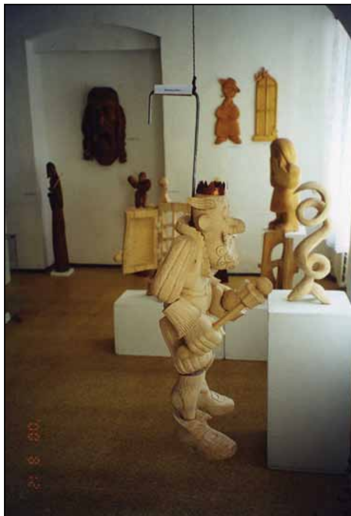
Výstava v Malé galerii Městské knihovny Doksy