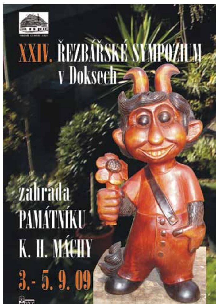
rok 2009, plastika Jaroslav Kunderát, autorka Jana Jakubská