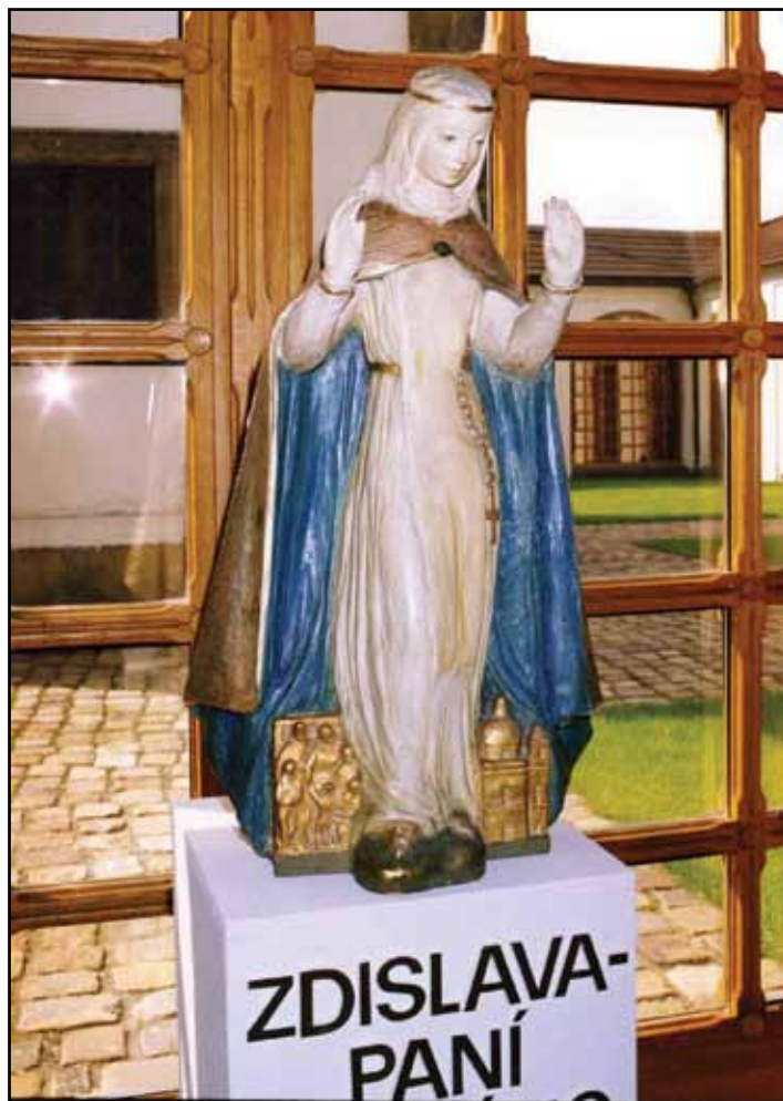
V muzeu v prostorách ambitu se v tomto roce uskutečnila rozsáhlá výstava o svaté Zdislavě.