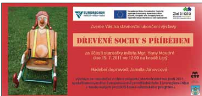
Foto vlevo: V rámci Mezinárodního roku lesů byla uspořádána v několika německých a českých městech výstava soch Zdeňka Viléma.