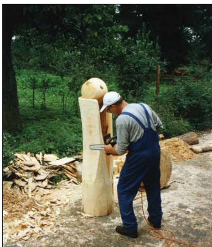
Foto vpravo: V roce 2001 poprvé tvořili sochaři v zámeckém parku v Doksech velké dřevěné plastiky pomocí motorových pil.