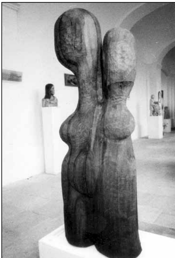
Plastika od Jaroslava Rusa na společné výstavě neprofesionálních výtvarníků v ambitu muzea v České Lípě v roce 1986.