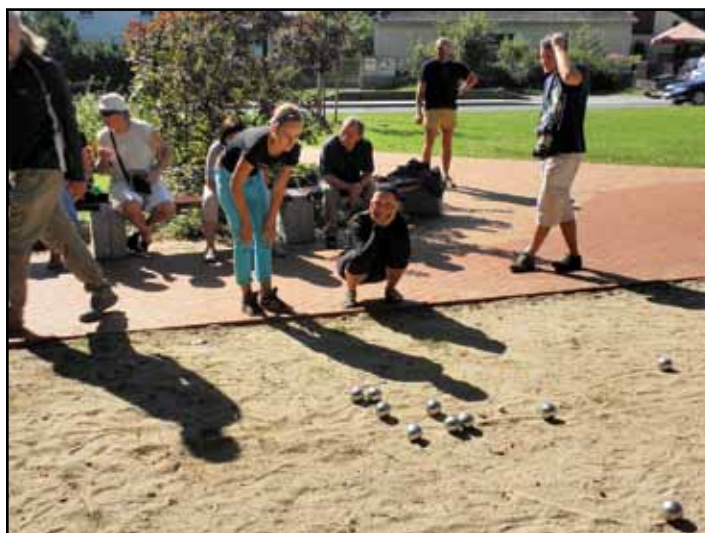
Turnaj v petanque na Lipovém náměstí v Doksech