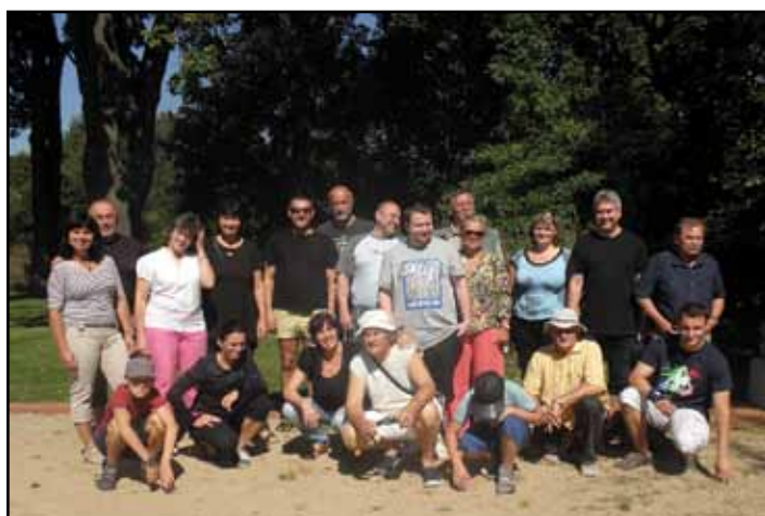
Účastníci turnaje v petanque