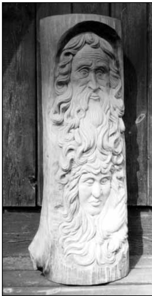
Plastika Petra Jelínka