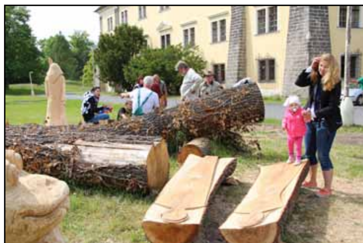
Také v zámeckém parku bylo sympozium přístupné pro veřejnost.