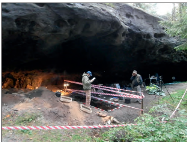
Obr. 11. Rozstání pod Ještědem, Jeřmanská skála (okr. Liberec). Průběh záchranného archeologického výzkumu dokumentujícího lokalitu poškozenou trampy. Výzkum financoval Liberecký kraj.

tak mohou vhodně doplnit učební látku probíranou v hodinách dějepisu. Archeologické dědictví je prezentováno i na celostátní úrovni, například na veletrhu Památky v Praze – Holešovicích v roce 2012 (Obr. 9). Zde bylo představeno nové Archeologické muzeum Šatlava v České Lípě. Tento historický objekt byl zrekonstruován v letech 2009–2011 s přispěním Regionálního operačního programu NUTS II Severovýchod. Nová expozice je zaměřena na archeologii města Česká Lípa a zejména na speleoarcheologii (Obr. 10).