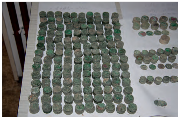
Obr. 5. Roztoky u Jilemnice (okr. Semily). Nález 2016 mincí různých nominálních hodnot a 11 dalších kovových předmětů, který byl uložen do země těsně před začátkem 2. světové války, nález 2013. Foto J. Prostředník, 2013

Druhý případ z roku 2013 se týkal nálezů 2016 mincí různých nominálních hodnot a dalších 11 kovových předmětů (Obr. 5), který byl uložen do země těsně před začátkem 2. světové války v Roztokách u Jilemnice (okr. Semily). Mincovní nález je zajímavý nejen dobou svého uložení, ale i tím, že byl uložen jednak uvnitř dělostřelecké nábojnice granátu (vzor 1937, ráže 7,5 cm, délka 28 cm), jednak v plechové dóze (průměr 11 cm, délka 25 cm). Je velmi pravděpodobné, že se nález dochoval celý, což zvyšuje jeho kulturně historickou hodnotu. Nález obsahoval kromě odznaků, svátostek, křížků a spon typické oběhové mince období první Československé republiky a příměs 49 kusů zahraničních ražeb, z nichž početně je nejvýznamnější soubor srbských mincí z let 1884–1915. Charakter nálezového materiálu, v němž chybí vzácné exempláře mincí,