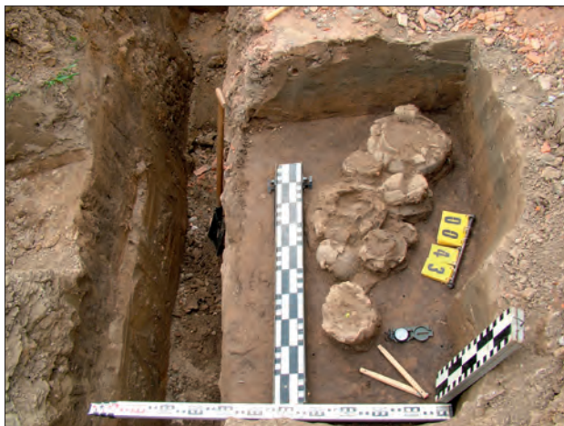
Obr. 2. Příšovice, poloha Na Cecilce (okr. Liberec). Detail odkrytého žárového hrobu č. 43 z pozdní doby bronzové. Foto P. Brestovanský, 2006