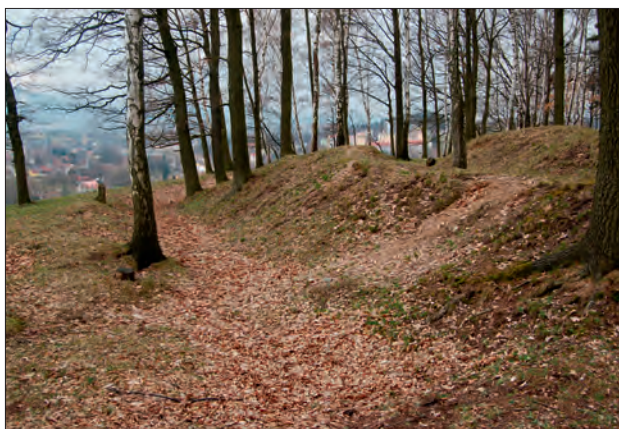
Obr. 3. Vratislavice n. N. (okr. Liberec). Vrch zvaný Šance mezi Prosečí n. N. a Vratislavicemi n. N., na jehož zalesněném vrcholu se nachází relikt polního opevnění typu reduta. Foto autor, 2008

absenci nových kulturních památek archeologického charakteru navázalo až rozhodnutí o prohlášení pohřebiště z doby bronzové v Příšovicích (okr. Liberec) v poloze „Na Cecilce“ ze dne 13. 3. 2007 (Obr. 1, 2). Následně byla s účinností ode dne 19. 6. 2010 prohlášena i zaniklá sklárna v Bedřichově (okr. Jablonec nad Nisou) a dne 13. 9. 2011 i soubor novověkých polních dělostřeleckých opevnění mezi Libercem a Jabloncem nad Nisou (Obr. 3). Mnoho jsme však dlužni i při prezentaci archeologických lokalit veřejnosti. Až na několik výjimek postrádáme v terénu i elementární informační tabule seznamující návštěvníky s významem dané chráněné lokality (podrobně Nechvíle 2014 v tisku).