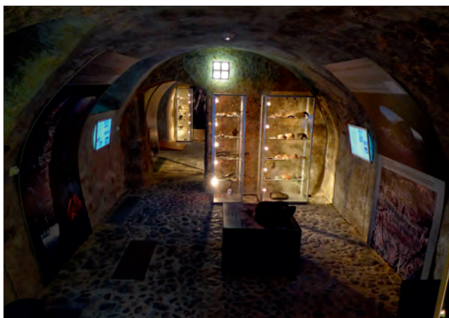
Obr. 10. Pohled do expozice Archeologického muzea Šatlava v České Lípě.