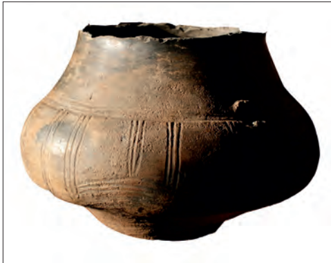
Obr. 4. Lešnice u Dubé (okr. Česká Lípa). Terinovitá amfora z pozdní doby bronzové, nález z roku 2009.

V prvním případě, kdy bylo nálezné vyplaceno, se jednalo o nález terinovitě amfory z pozdní doby bronzové (R HB 3 lužická kultura / časná fáze kultury billendorfské) z lokality Lešnice u Dubé (okr. Česká Lípa) v CHKO Kokořínsko (Obr. 4). Nález byl učiněn v roce 2009. Ze zákona má krajský úřad povinnost vyžádat si u archeologických nálezů odborný