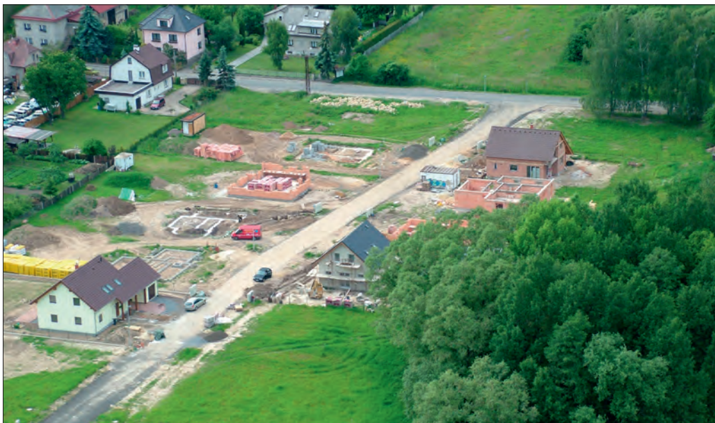
Obr. 1. Příšovice, poloha Na Cecilce (okr. Liberec). Letecký pohled na lokalitu. Foto P. Brestovanský, 2006

V současné době (stav k 22. 1. 2014) obsahuje ÚSKP pro území Libereckého kraje celkem 2242 nemovitých věcí, které jsou prohlášeny za kulturní památky, z čehož u 24 lokalit jsou předmětem ochrany i „archeologické stopy“, tedy pouhé cca 1 %. Pokud z této skupiny odfiltrujeme zříceniny hradů či tvrzí, kde je dochována torzální architektura, a ponecháme pouze zcela archeologizované objekty, výčet se zúží na 17 lokalit. V minulosti probíhal zápis na seznam kulturních památek pro okres Liberec jednorázovým aktem Školské komise Okresního národního výboru v Liberci ze dne 26. 11. 1964. Pro okres Semily také jednorázovým aktem Okresního národního výboru Semily z 27. 11. 1963. Není jasné, podle jakých kritérií byly lokality vybírány, ale zdá se, že to probíhalo dosti nevyváženě a nahodile. Část lokalit byla pravděpodobně vybírána na základě publikovaných nálezů v knize Jana Filipa Dějinné počátky Českého ráje z roku 1947. Jak vyplývá z analýzy chráněných archeologických lokalit, nebyla od roku 1964 do roku 2007 za kulturní památku zapsána či prohlášena ani jedna lokalita. Na tuto 43 let trvající