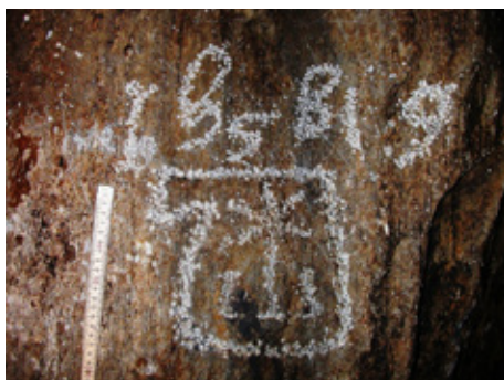
Nejstarší letopočtem datovaný epigraf v jeskyni (1519); Dvojitá srdcová chodba (E). Foto: T. Slavík – P. Jenč, stav k r. 2005

Jeskyně Na Špičáku představuje v rámci historicky využívaných jeskyní spolu s Býčí skálou epigraficky nejbohatší dochovanou lokalitu na území České republiky, která je jako jediná zpřístupněna široké veřejnosti. V letech 2003–2010 v jeskyni probíhal rozsáhlý projekt záchranné dokumentace historických nápisů a maleb, který realizovalo Pracoviště speleoantropologie Vlastivědného muzea a galerie v České Lípě (P. Jenč a kolektiv) ve spolupráci s externími odborníky a Správou jeskyní ČR, zejména pracovištěm Správy Jeskyně