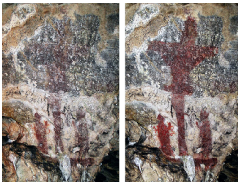
Malba Adorace Kříže před restaurátorským zásahem (vlevo, stav k r. 2009) a po restaurátorské obnově na podzim roku 2013.

Soubor malovaných objektů evidujeme na větvení Hlavní a Dvojité srdcové chodby. Ústřední malba jeskyně – Adorace (uctívání) Kříže, od 60. let 20. století v literatuře nesprávně označovaná jako Kalvárie, je nejen nejvýznamnější historickou památkou jeskyně, ale v prostředí jeskyní Čech, Moravy a Slezska je objektem zcela výjimečným. U paty kříže jsou vyobrazeny dvě modlící se postavy, klanící se svatému Kříži. Tento námět je v renesančním