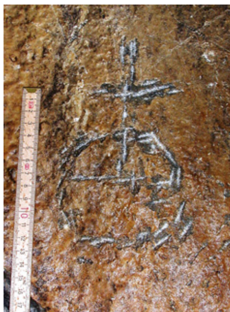
Vyobrazení říšského jablka v Dvojité srdcové chodbě (E).

Na Špičáku (E. Vozábalová). Výsledkem projektu je dokumentace zhruba 4 000 epigrafických objektů (přes 4 900 snímků) v 796 hlavních polohách všech částí jeskyně. V návazné části výzkumného projektu, zahájeného v roce 2011, byla zaměřena pozornost také na detailní prospekci skalních výchozů resp. lomových stěn v okolí jeskyně s dokumentací dalších epigrafických objektů.