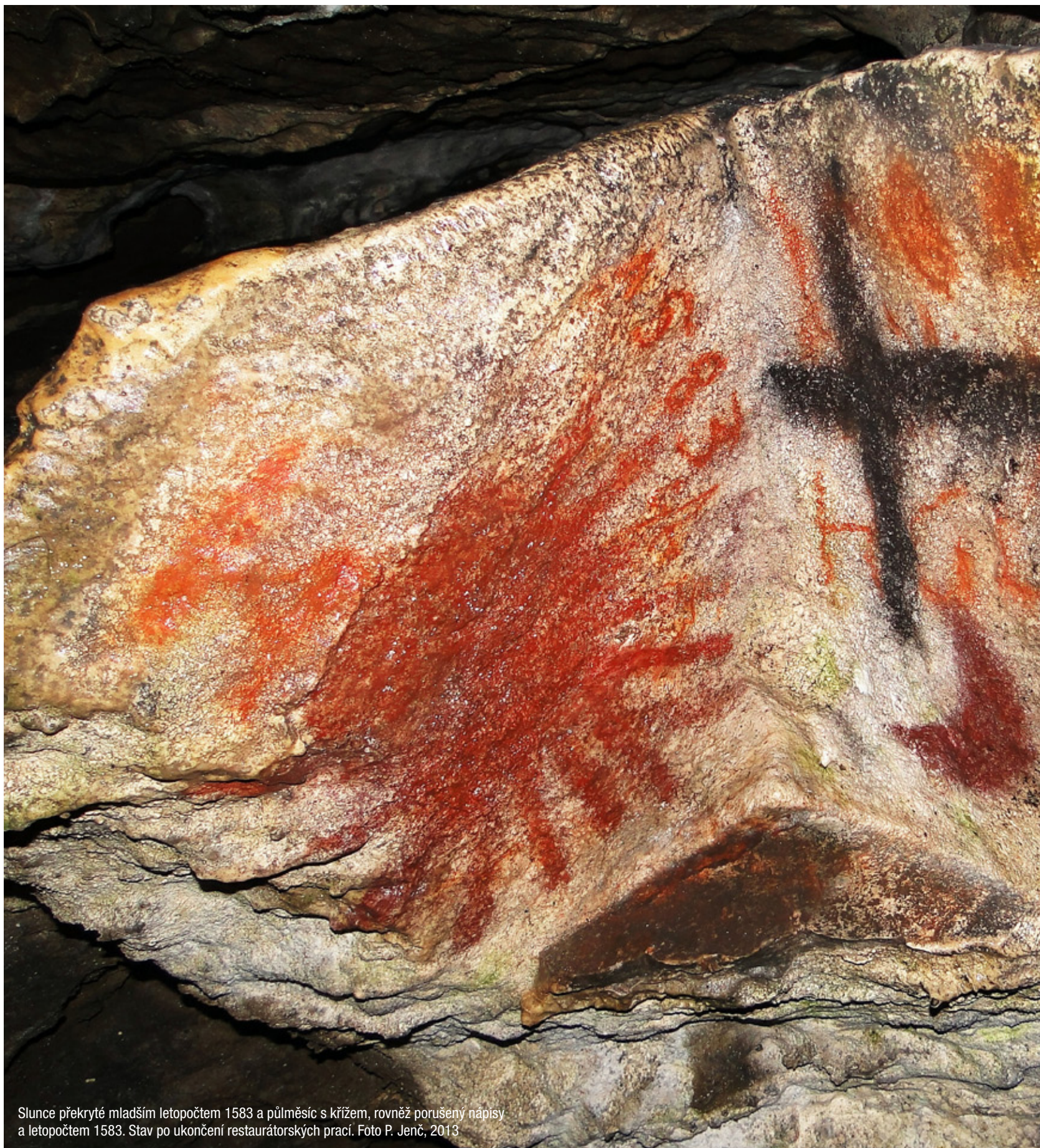
Slunce překryté mladším letopočtem 1583 a půlměsíc s křížem, rovněž porušený nápisy a letopočtem 1583. Stav po ukončení restaurátorských prací. Foto P. Jenč, 2013