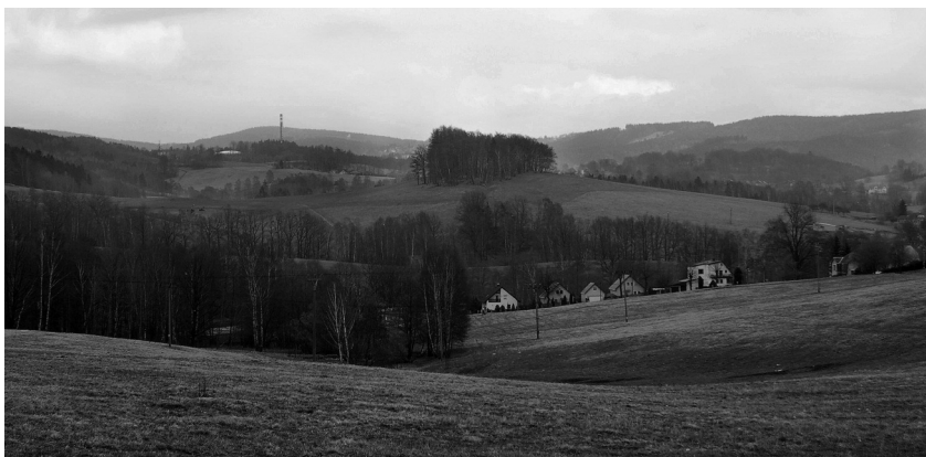
Pohled od SZ na vrch zvaný Šance mezi Prosečí n. N. a Vratislavicemi n. N., na jehož zalesněném vrcholu se nachází opevnění č. 6 (tzv. reduta)