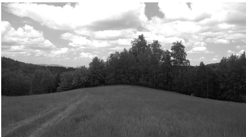
Pohled od JV na ostrožnu, na jejímž konci se v lese nachází opevnění č. 5 (tzv. redan)

Ne všechna na mapě vyznačená opevnění se dochovala dodnes. Jedna větší pevnost (ve vojenské terminologii tzv. reduta ) se nacházela na okraji tehdejšího intravilánu vesnice Luxdorf (Lukášov) a byla patrně zcela zničena pozdější výstavbou domů. Ostatní pevnosti, které se nacházely v lese, se až na jednu výjimku zachovaly velmi dobře. Tou výjimkou je opevnění č. 4 (tzv. barkan ), které bylo z větší části zničeno při budování otočky pro těžkou lesní techniku. I přesto jsou relikty této fortifikace v terénu částečně patrné. V terénu se nejvýrazněji zachovalo první objevené opevnění č. 5 (tzv. redan ). Jedná se o šipovitý útvar, jehož ramena svírají zhruba pravý úhel. Fortifikace byla vybudována na mírně ostrožně tím způsobem, že byl nejprve vyhlouben příkop a vytěžený materiál posloužil pro navržení valu. Takto vybudované opevnění fungovalo jako vyvýšené a chráněné postavení pro