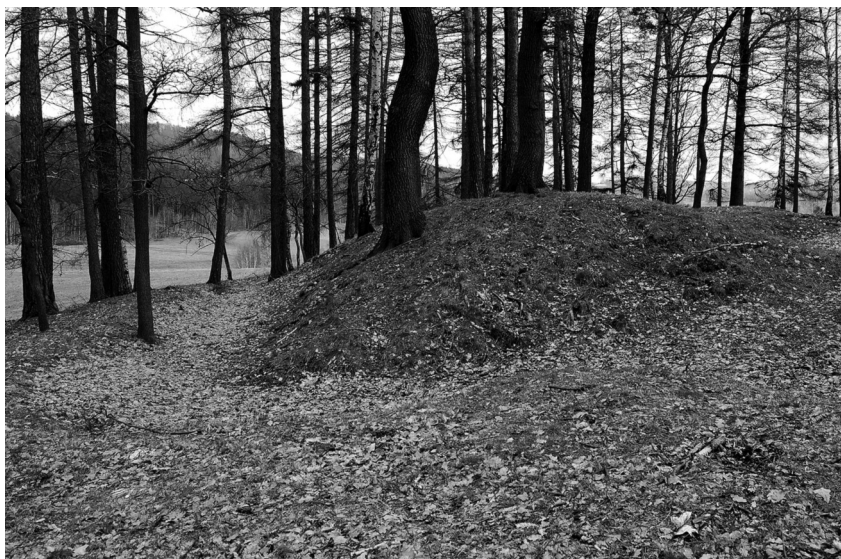
Opevnění č. 6, detail palebného postavení pro dělo