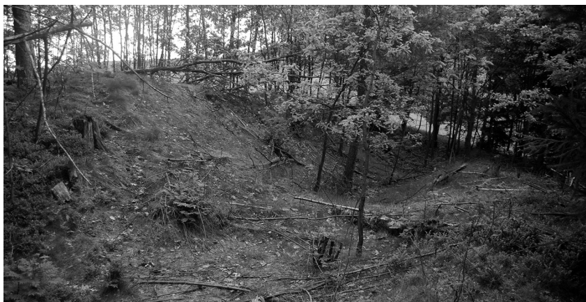
Opevnění č. 5 (tzv. redan ), relikv příkopu s valem

Klíčovou roli při interpretaci jakéhokoli nálezu hraje určení stáří, díky němuž je pak zpravidla možné daný nález zařadit do širšího historického kontextu. V našem případě nebyly na místě opevnění nalezeny žádné movité archeologické nálezy, a tak jsme odkázáni na písemné či kartografické prameny. Díky vyznačení nalezených opevnění na dochované mapě tzv. 1. vojenského mapování z let 1764–1768 (rektifikace v letech 1780–1788) máme poměrně konkrétní časovou představu doby vzniku těchto fortifikací, tedy 2. polovina 18. století. Při určení konkrétní události či konfliktu, v rámci něhož byla opevnění zbudována, se dostáváme do určitých nesnází. V zásadě se nabízí dva konflikty, v rámci nichž mohlo k výstavbě dojít. První je období tzv. sedmileté války v letech 1756–1763, ve kterém se v našem regionu utkala vojska rakouská a pruská. Nejvýznamnější vojenskou operací tohoto konfliktu se stala bitva u Liberce 21. dubna 1757. V rámci přípravy tohoto střetnutí