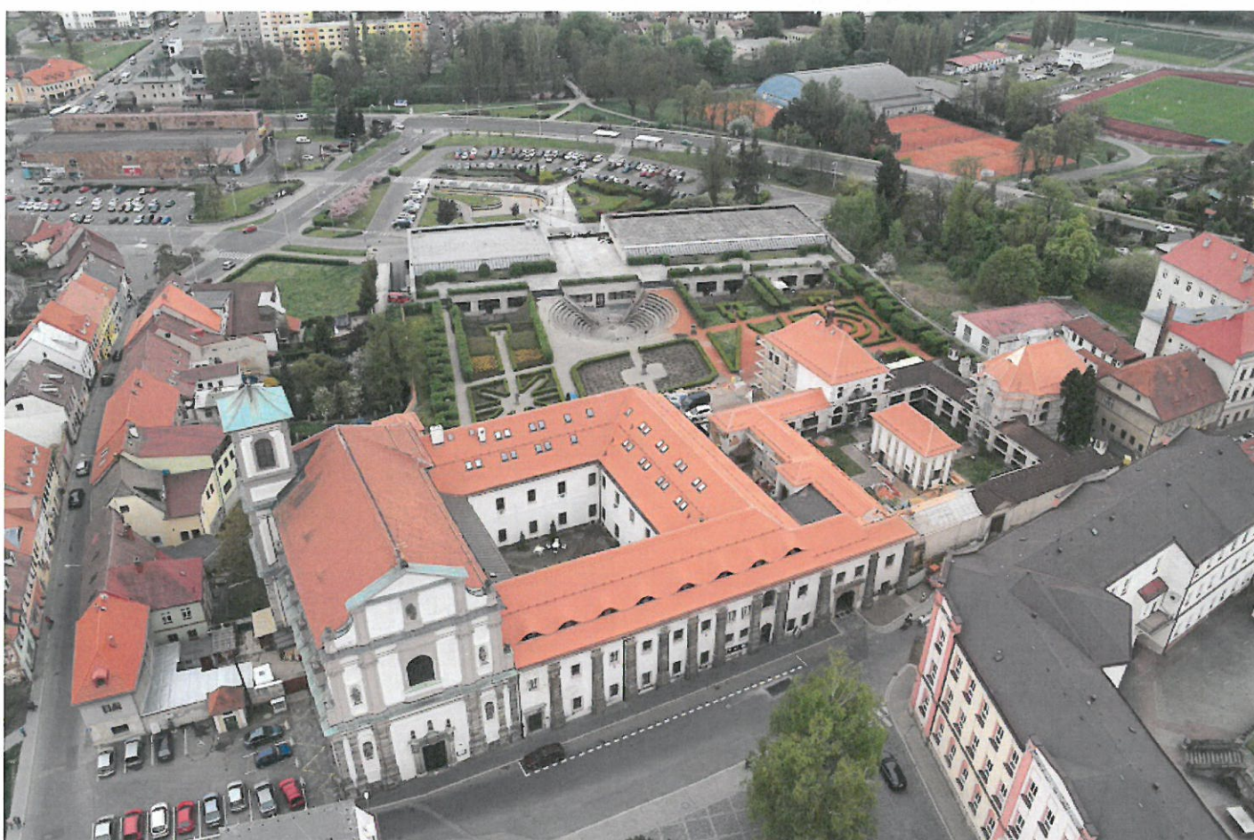
Areál kláštera v České Lípě při generální rekonstrukci střešního pláště, která probíhala v roce 2014 a byla v plné výši financována Libereckým krajem.

Věřím, že naše Vlastivědné muzeum a galerie v České Lípě bude také v roce 2015 opět centrem vzdělání a zábavy na Českolipsku, a to i přes řadu omezení, která vyplývají z realizované stavby.