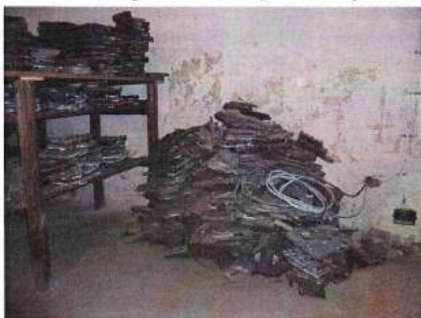
Stav textilních potiskovacích forem před stěhováním.