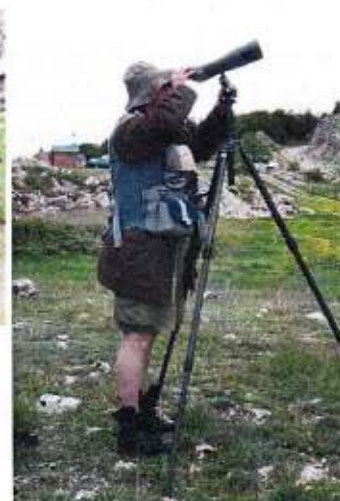
Terénní zoologický výzkum a průzkum v pohraničí Černé hory a Albánie.