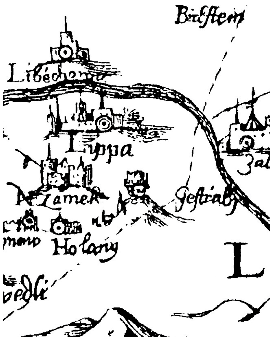
Obr. 1. Výřez z mapy Pavla Aretina z Ehrenfeldu z roku 1619, resp. 1632, s vyobrazením hradu Jestřebí (Mapová sbírka Univerzity Karlovy v Praze, sign. D1/8/1; jako celek je mapa dostupná on-line: http://www.staremapy.cz/antos/zoomify/aretin.html ). – Abb. 1. Landkartenausschnitt der Landkarte von Pavel Arentin von Ehrenfeld vom Jahr 1619, bzw. 1632, mit der Abbildung der Burg Habichstein (Landkartensammlung der Karls Universität in Prag, Signatur D1/8/1, als Ganzes steht die Landkarte auf http://www.staremapy.cz/antos/zoomify/aretin.html zur Verfügung.

Aretinova mapa se odlišuje od jiných map tím, že místa zde nejsou vyznačena pouze kroužkem či jinou podobnou značkou, ale malou kresbou města, hradu či zámku. V řadě případů nemůže být pochyb, že autor uvedená místa znal, ať již z autopsie či z jiného vyobrazení, neboť jsou vyobrazena s neobvyklým smyslem pro realitu. Takovým místem je nepochybně právě hrad Jestřebí (obr. 1).