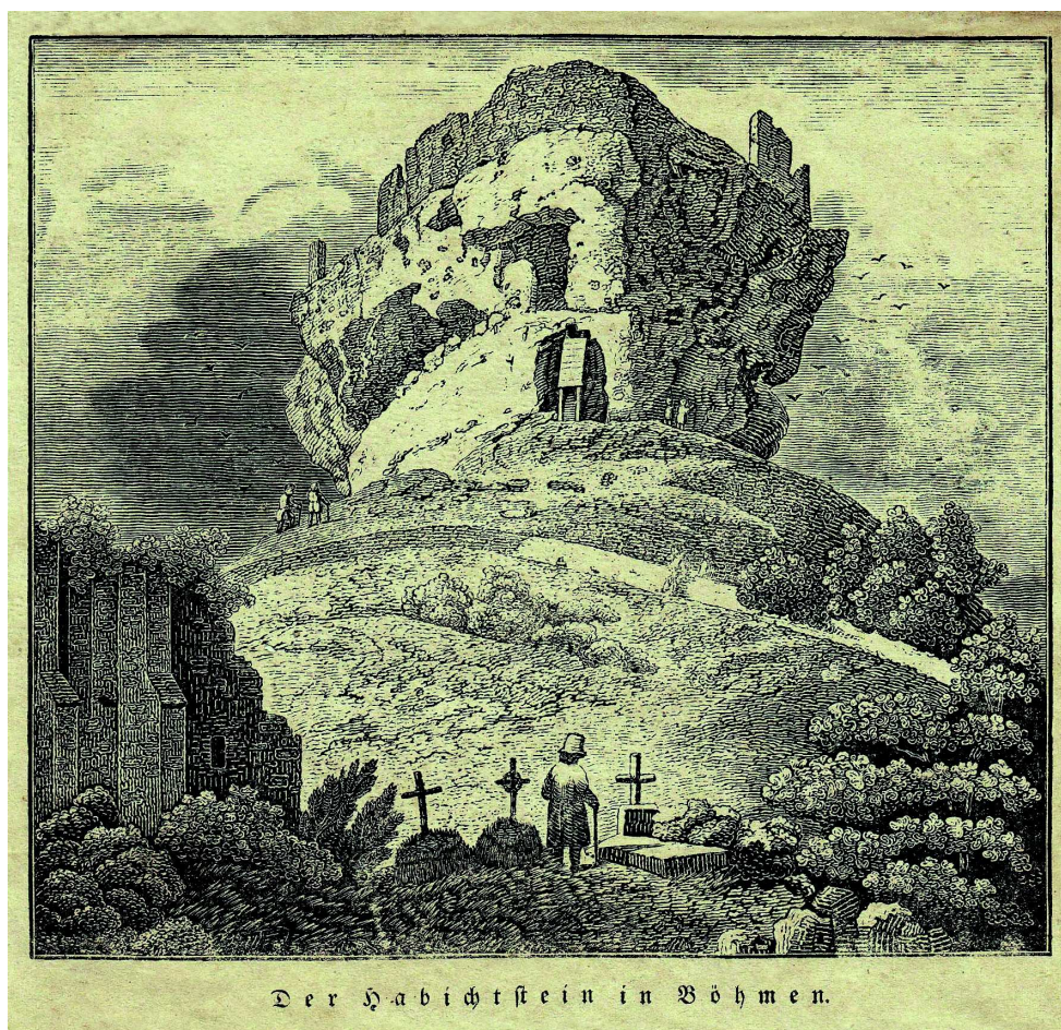
Obr. 4. Nesignovaná a nedatovaná litografie hradu Jestřebí z doby po roce 1825 (Vlastivědné muzeum a galerie v České Lípě, Sběrka grafiky, inv. č. V-5425). – Abb. 4. Lithografie der Burg Habichstein ohne Signatur und Datierung aus dem Zeitraum nach dem Jahre 1825 (Heimatkundliches Museums und Galerie in Böhmisches Leipa, Grafische Sammlung, Inv. Nr. V-5425)