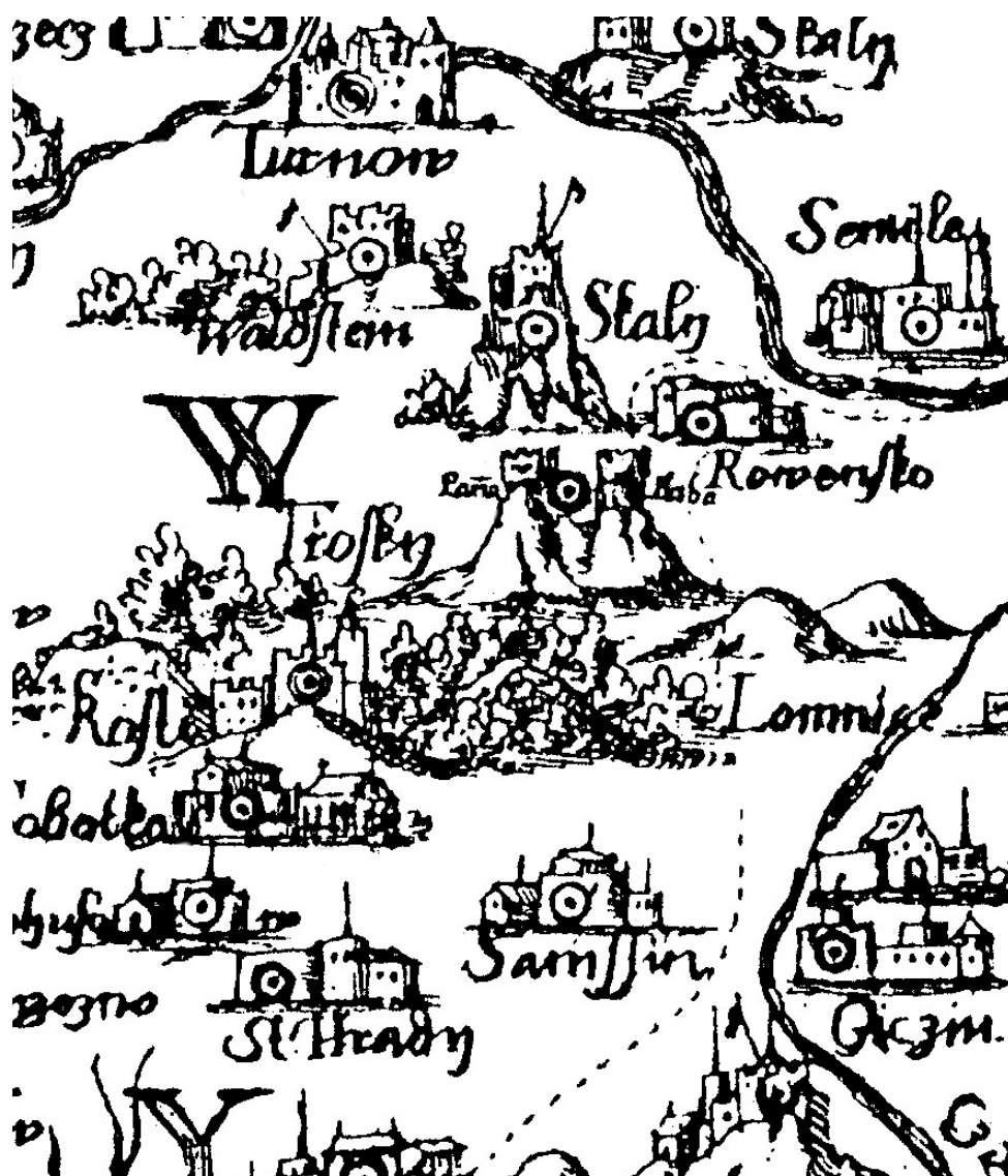
Obr. 2. Výřez z mapy Pavla Aretina z Ehrenfeldu z roku 1619, resp. 1632, s vyobrazením hradů Trosky a Kost (Mapová sbírka Univerzity Karlovy v Praze, sign. D1/8/1; jako celek je mapa dostupná on-line: http://www.staremapy.cz/antos/zoomify/aretin.html ). – Abb. 2. Landkartenausschnitt der Landkarte von Pavel Aretin von Ehrenfeld vom Jahr 1619, bzw. 1632, mit der Abbildung der Burgen Trosky und Kost.

Neobyčejnou věrnost v zachycení podoby hradu Jestřebí potvrzuje na mapě vyobrazení dalšího zajímavého hradu, jímž jsou Trosky (obr. 2). Naprosto přesně jsou tu zachyceny oba sopečné sopouchy s věžemi na nich a dokonce i s jejich pojmenováním (Paňa, Baba). Jedná se pravděpodobně o nejstarší písemné zachycení názvů obou věží. Dostí realisticky s velkou věží je zachycen také nedaleký hrad Kost. Při pohledu na mapu bychom v jiných oblastech nepochybně objevili další lokality překvapující svým věrným vyobrazením.