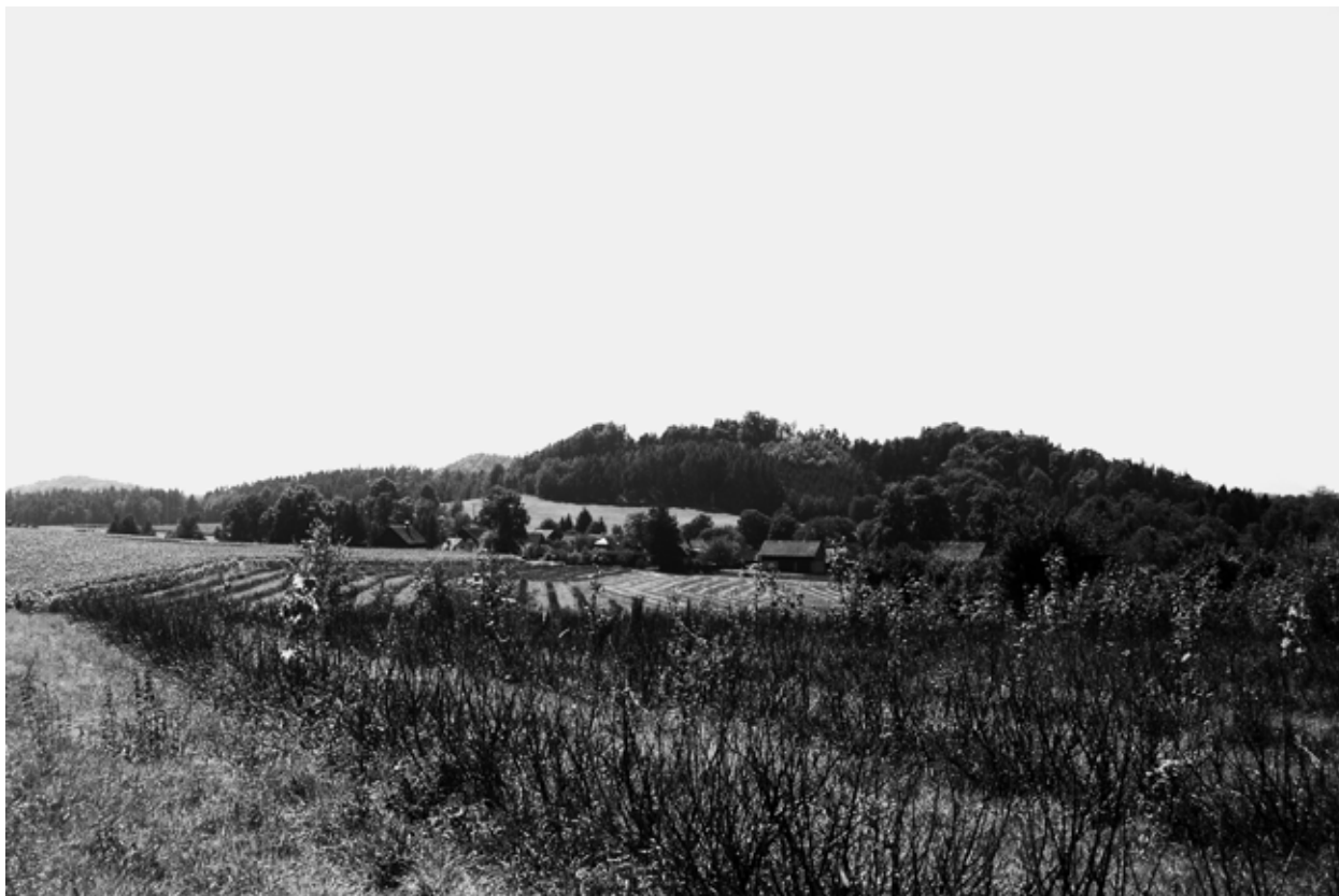
Obr. 9: Kotel, okr. Liberec. Antošův kopec, pohled od SV.

Nelze připustit, aby chráněné lokality nenabízely veřejnosti ani základní informaci o svém významu a jedinečnosti. Za překonaný lze považovat argument nezveřejňování lokalit z důvodu ohrožení ze strany nelegálních uživatelů detektorů kovů a vykradačů archeologických lokalit.