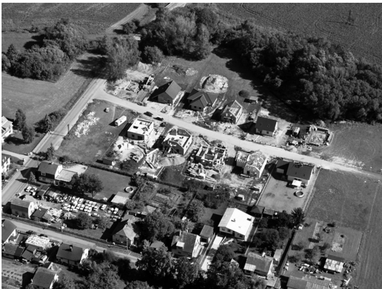
Obr. 3: Příšovice, okr. Liberec, poloha Na Cecilce. Letecký pohled na lokalitu, nezastavěnou parcelu při silnici vykoupil Liberecký kraj z důvodu ochrany archeologického dědictví.

Ministerstvo kultury ČR význam této lokality zhodnotilo ve svém rozhodnutí o prohlášení věci za kulturní památku č. j. 7157/2006 ze dne 30. 1. 2007 takto: „ Příšovické pohřebiště kultury lužických popelnicových polí (slezská fáze) je v takovém rozsahu a zachovalosti ojedinělým archeologickým nálezem jak na našem území, tak i v kontextu celé střední Evropy. Vzhledem k tomu, že lid této kultury již neexistuje, je jediným možným zdrojem informací o jejich, a tím i o naší, historii a způsobu života. Jedná se o nevratné archeologické dědictví, které bychom se měli snažit zachovat i pro další generace. “