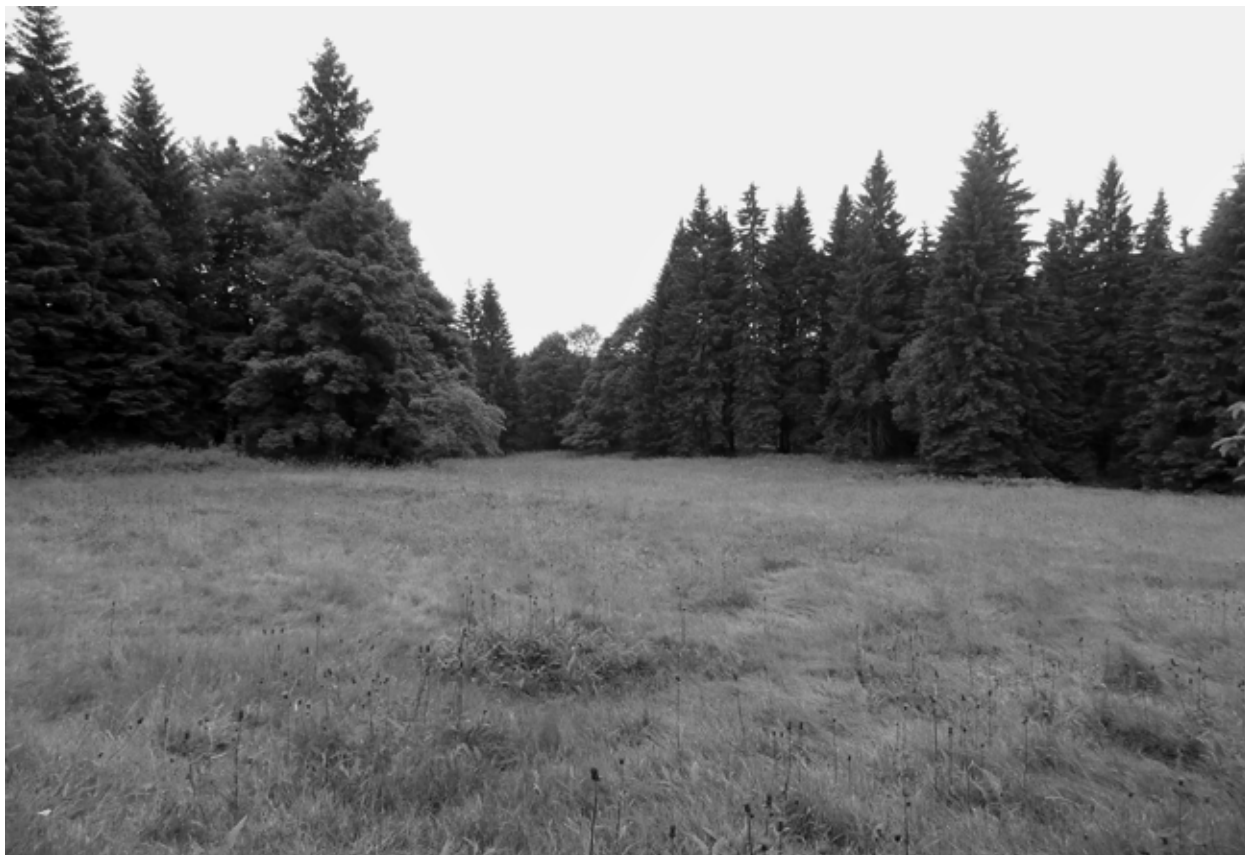
Obr. 7: Kristiánov, okr. Jablonec n. N. Sklářská osada. Pohled na zalesněný areál bývalé sklárny. Foto autor, 2013.