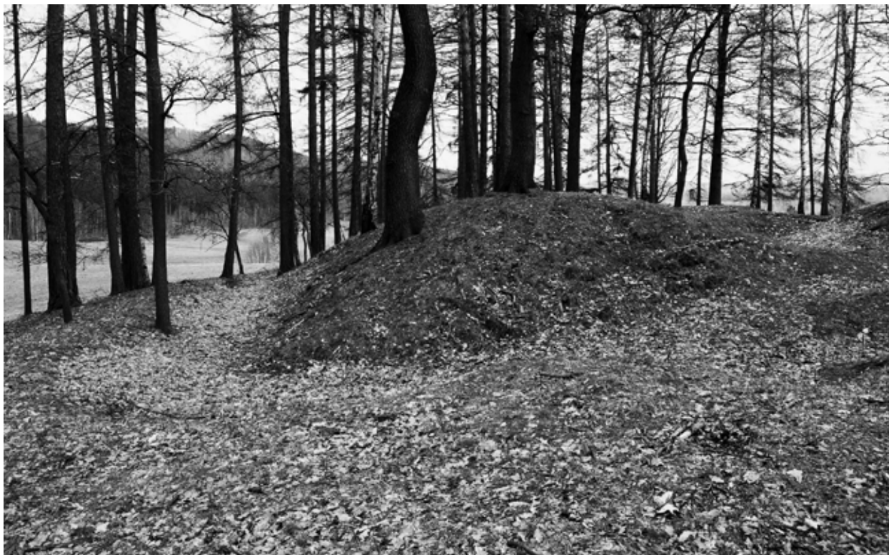
Obr. 5: Vratislavice n. N., okr. Liberec. Vrch zvaný Šance mezi Prosečí n. N. a Vratislavicemi n. N., na jehož zalesněném vrcholu se nachází polní opevnění typu reduta. Foto autor, 2008.

Archeologický potenciál území Libereckého kraje je však značně větší a bohatší, než odráží 17 památkově chráněných archeologických lokalit. Nejzřetlivější kandidát na novou kulturní památku se nachází rovněž na katastru Příšovic, tentokrát na ploše vedle logistického areálu VGP na celkem osmi parcelách č. 245/60, 245/54, 245/55, 245/56, 245/57, 245/58, 245/59, 245/6 o celkové výměře cca 3,3 ha. V současné době jsou předmětné pozemky využívány