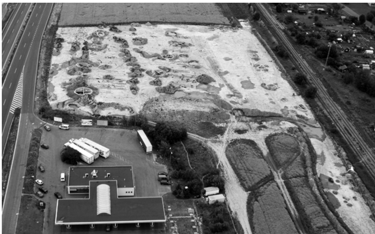
Obr. 6: Příšovice – VGP, okr. Liberec. V popředí probíhající záchranný archeologický výzkum na stavbě logistického centra, vzdálenější osetá část plochy navrhována na zápis za kulturní památku.

Abb. 6: Příšovice – VGP, Bez. Liberec. Im Vordergrund ist sichtbar die laufende archäologische Rettungsgrabung auf der Baustelle eines logistischen Zentrums. Der entferntegesäte Teil der Fläche wurde als Kulturdenkmal vorgeschlagen.