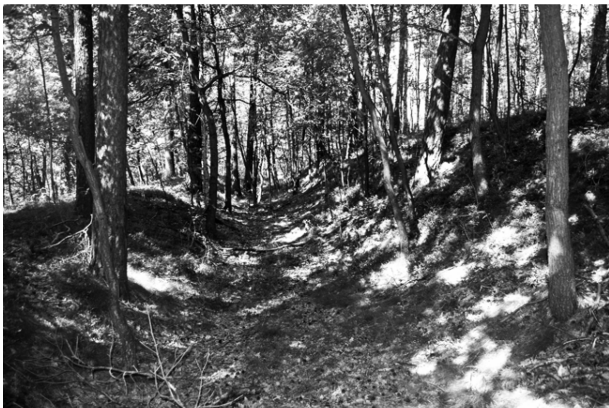
Obr. 10: Kotel, okr. Liberec. Poloha Šance, pohled od JZ. Foto autor, 2012.