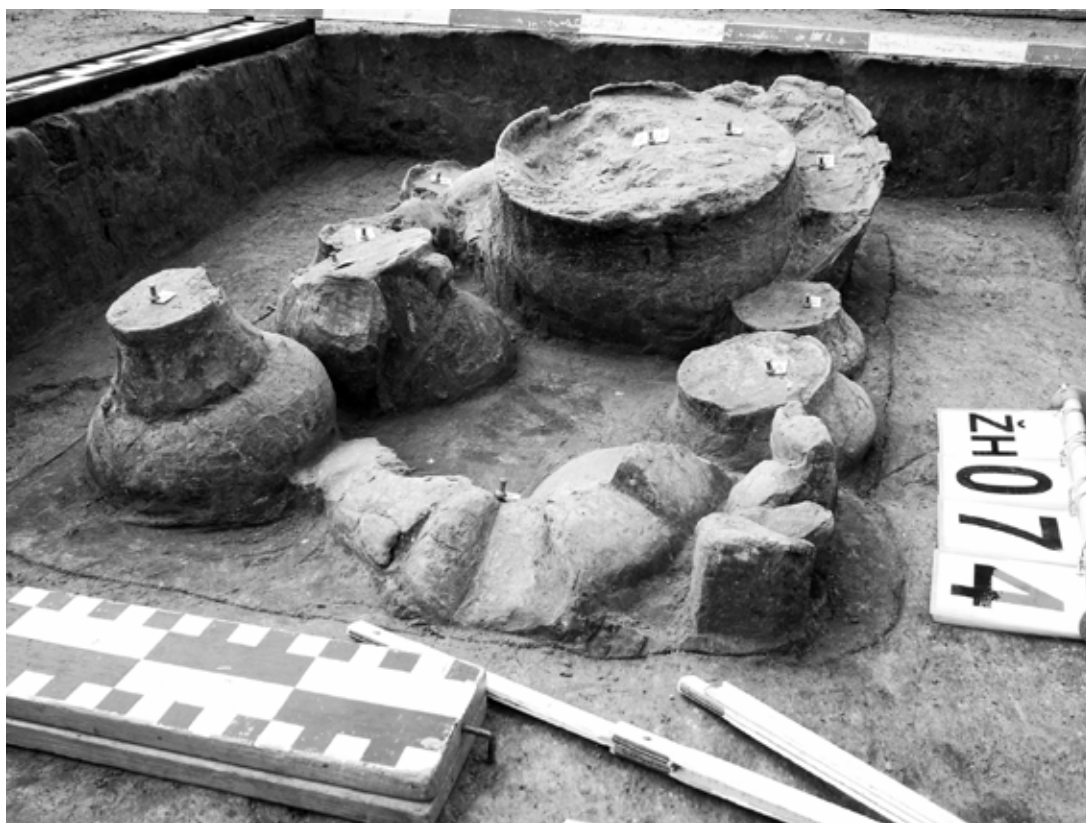
Obr. 2: Příšovice, okr. Liberec, poloha Na Cecilce. Detail odkrývaného žárového hrobu č. 74 z pozdní doby bronzové.

Jak již bylo výše uvedeno, tato výjimečná archeologická lokalita byla po více než čtyřicetileté odmlce první, která byla prohlášena za kulturní památku. Žárové pohřebiště z pozdní doby bronzové (slezská fáze, cca 950/920–800 př. n. l.) se nachází na nevýrazné terase (241–243 m n. m.) cca 300 m od současného toku Jizery. K nálezům žárového pohřebiště došlo v květnu 2005 a další hroby byly postupně odkrývány během záchranného archeologického výzkumu vyvolaného stavbou rodinných domů. Odkryto a prozkoumáno bylo 85 žárových hrobů (Obr. 2). Stovky pohřebních keramických nádob obsahovaly kromě kosterních ostatků i další předměty, například bohatě zdobené miniatury nebo