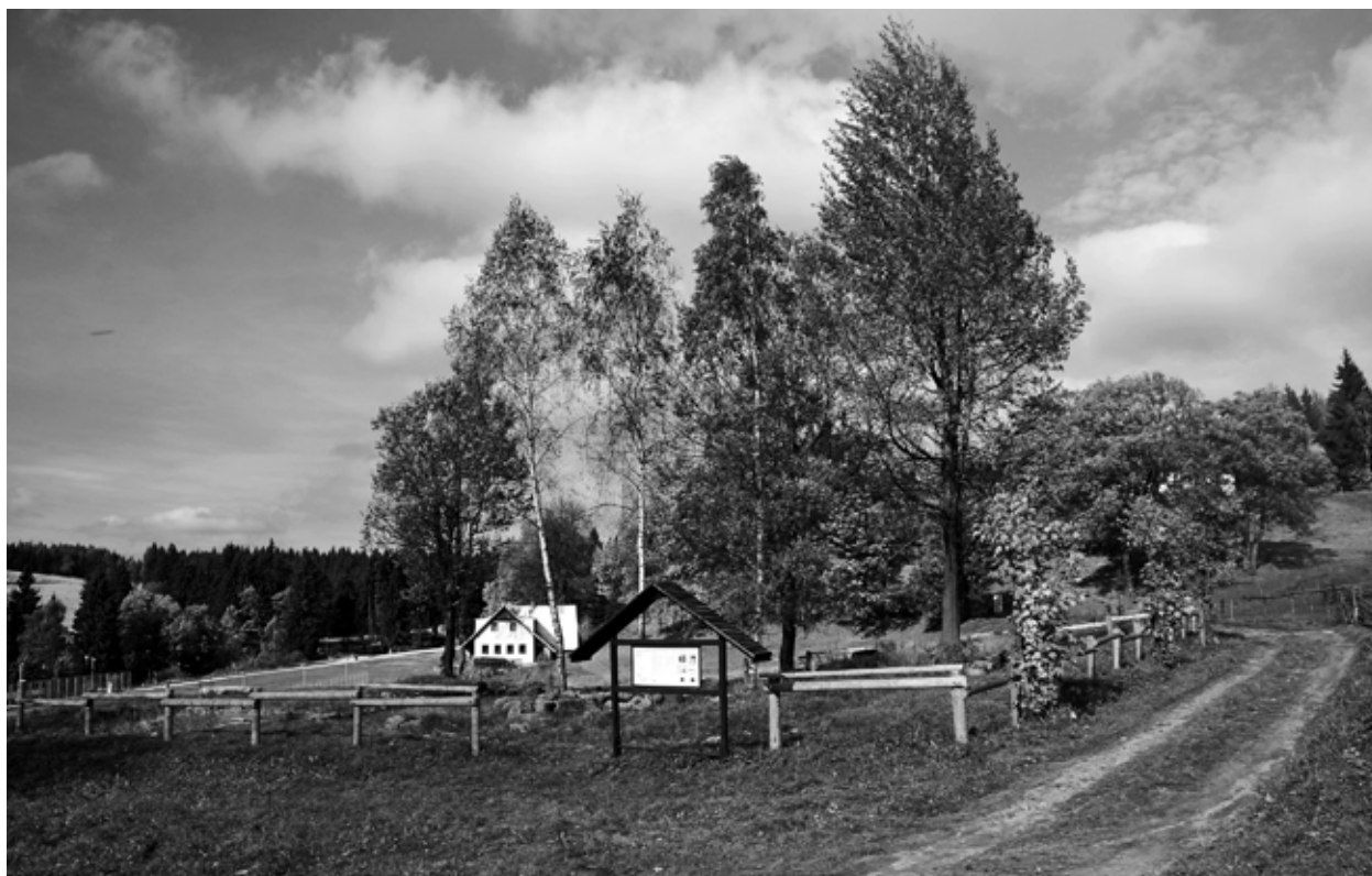
Obr. 4: Bedřichov – sklárna, okr. Jablonec n. N. Pohled areál odkrutých relikvů sklárny. Foto autor, 2010.

Relikty soustavy polního opevnění jsou první kulturní památkou tohoto druhu v Libereckém kraji. Soustava opevnění a záseků, které se nacházejí na k. ú. Lukášov (parc. č. 154, 158), Kunratice u Liberce (parc. č. 294/6, 356, 357, 50/2) a Vratislavice nad Nisou (parc. č. 1161/1, 1161/2), je velmi dobře zachována a je jedním z mála dochovaných archeologizovaných dokladů válečných akcí 2. poloviny 18. století na Liberecku a Jablonecku (Obr. 5). Význam nálezů sestávajícího ze šesti zjištěných dělostřeleckých pevností a záseků je právě v zachycení jejich systému v konfiguraci krajiny. Jejich strategickou důležitost potvrzuje i velmi přesné zakreslení do listu 1. vojenského mapování. Nejedná se tedy pouze o jednotlivosti, ale o ucelený systém opěrných bodů dokládající defenzivní vojenskou taktiku 2. poloviny 18. století. Nejpravděpodobnějším časovým zařazením vzniku nalezených polních opevnění je tzv. válka o dědictví